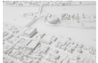
*石巻[宮城県石巻市]

[制作地域] 岩手県 | 野田[九戸郡野田村] / 田野畑[下閉伊郡田野畑] / 田老[宮古市] / 女遊戸[宮古市崎山] / 重茂[宮古市重茂] / 山田[下閉伊郡山田町] / 根浜[釜石市鶴住居町] / 釜石[釜石市] / 唐丹[釜石市唐丹町] / 崎浜[大船渡市三陸町越喜米] / 大船渡[大船渡市] / 陸前高田[陸前高田市] 宮城県 | 唐桑・大沢[気仙沼市] / 鹿折-1[気仙沼市] / 鹿折-2[気仙沼市] / 気仙沼・南町[気仙沼市] / 弁天町[気仙沼市] / 南気仙沼駅周辺[気仙沼市] / 大島[気仙沼市] / 陸上・岩井崎[気仙沼市] / 本吉・大谷[気仙沼市] / 小泉[気仙沼市本吉町] / 志津川[南三陸町] / 長清水[本吉郡南三陸町戸倉] / 女川[社鹿郡女川町] / 石巻[石巻市] / 荻浜・小横浜[石巻市] / 鮎川浜[石巻市] / 荒浜[仙台市若林区] 福島県 | 相馬港[相馬市] / 浪江[双葉郡浪江町]