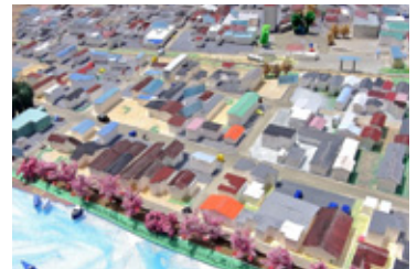
南気仙沼駅周辺[宮城県気仙沼市]